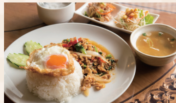
鶏肉とパジルを炒めた定番料理「カバオ ガイ ラア カオ」1,000円(税抜)。 サラダとスープ、デザートにコーヒーもついてリーズナブル!

東京での宝塚歌劇の拠点として、宝塚大劇場同様の舞台システムを備える。ちどり配列により、どの席からもステージが見えるよう設計。