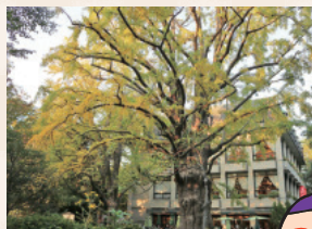
千代田区日比谷公園1-6 03-3501-6428 (日比谷公園サービスセンター)

日比谷公園は、明治36年に日本で最初に誕生した近代的洋風公園。毎年11月になると、園内の木々の葉が鮮やかに色付き始めます。見どころは、立派な鶴の噴水が目印の雲形池(写真上)。水面に紅葉が映りこみ、幻想的な世界が広がる絶景スポットです。他にも樹齢400年以上といわれる首賭けイチョウ(写真下)や、草地広場周辺にあるS字型園路のイチョウ並木も必見。都心のオアシスで、ゆったり秋景色を満喫してみてください。