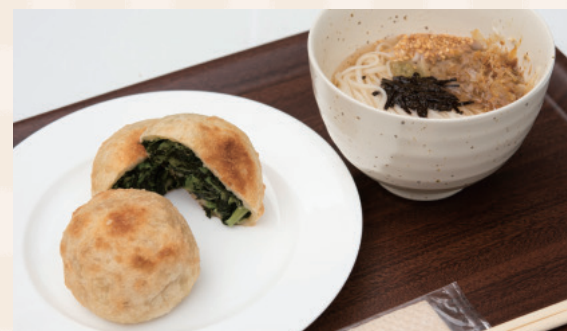
上品な香りと旨味が自慢の「うどん」(小)400円と、 4種類の具材から選べる信州名物「おやき」(単品)350円は外せない! (全て税抜)