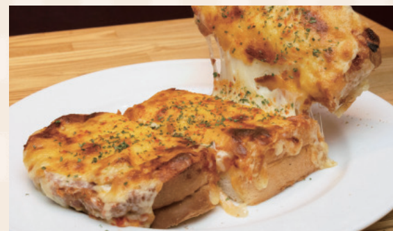
どこから食べても味が均一になるようにと、サラミなどの食材を刻んで 散りばめたという「元祖ピザトースト」1,000円(税込)。