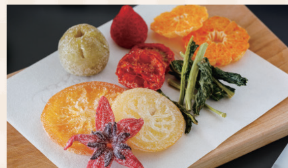
写真のレモンやマンゴーなど12種類入った「わふるバラエティギフトBOX」 5,940円の他、お店では1つからでも購入できます。216円～(全て税込)。